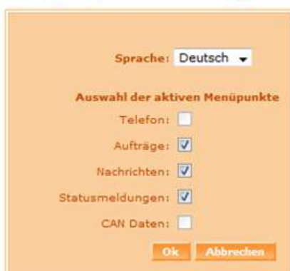
Displaykonfiguration für Fahrzeug 26008791 Displaykonfiguration für Fahrzeug 26008791

Hier wird Ihnen die aktuelle Einstellung des jeweiligen Displays angezeigt. Klicken Sie auf den „Bearbeiten“-Button vor dem gewünschtem Gerät.